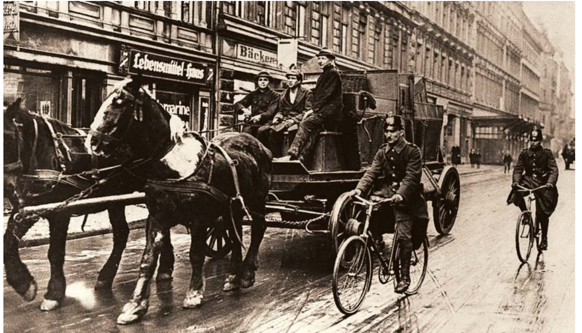
Η πρώτη αποστολή του Ογκινς ήταν στο Βερολίνο της Δημοκρατίας της Βαϊμάρης. Ακολούθησε το Παρίσι (κάτω), όπου είχε αναλάβει να κατασκοπεύει τους Ρομανόφ